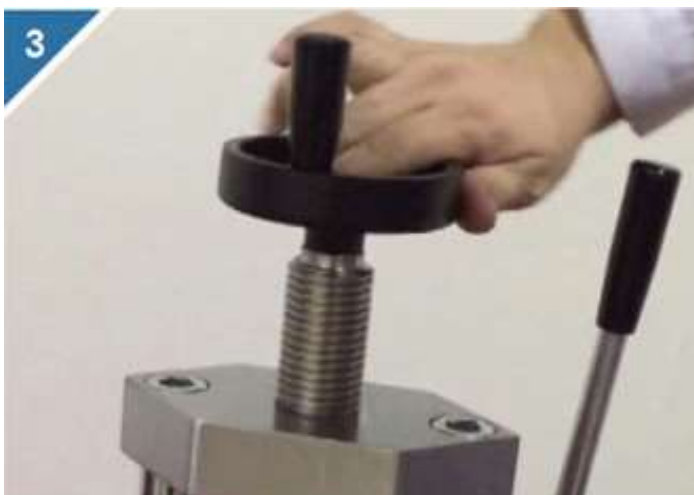
3、旋紧丝杠，将模具固定住。