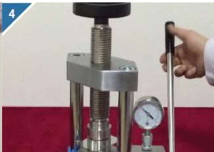
4、上下摇动压机手柄，达到所需压力。