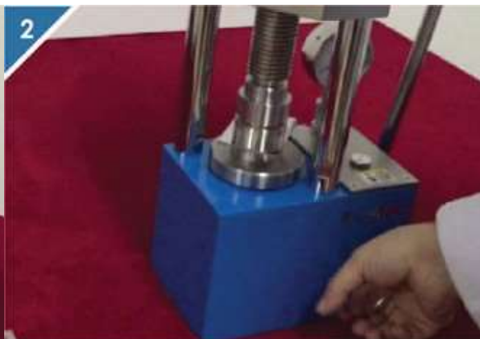
2、顺时针拧紧压片机放油阀门。