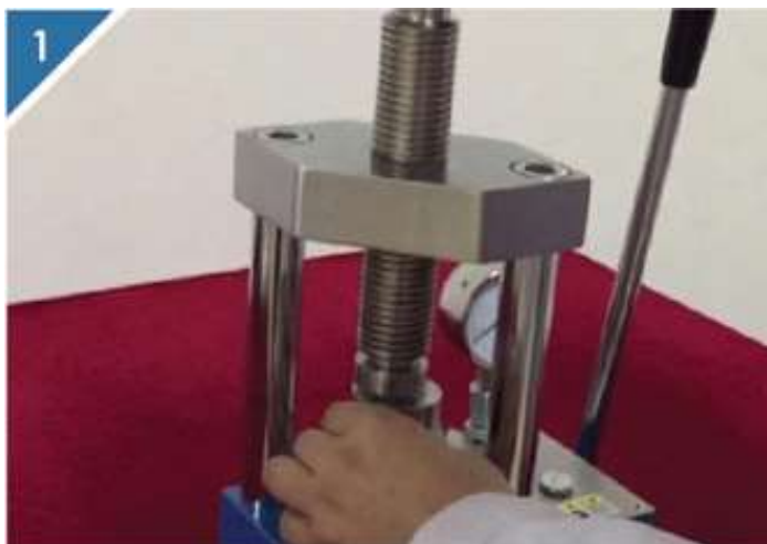
1、将组装好的模具放入压片机工作台中心位置。