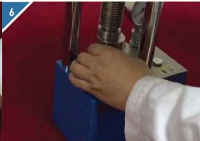
6、从压片机中取出压好的模具。